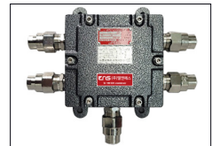
LS-EXP 4P Junction Box