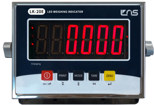
LK-20E 인디케이터 LED 디스플레이