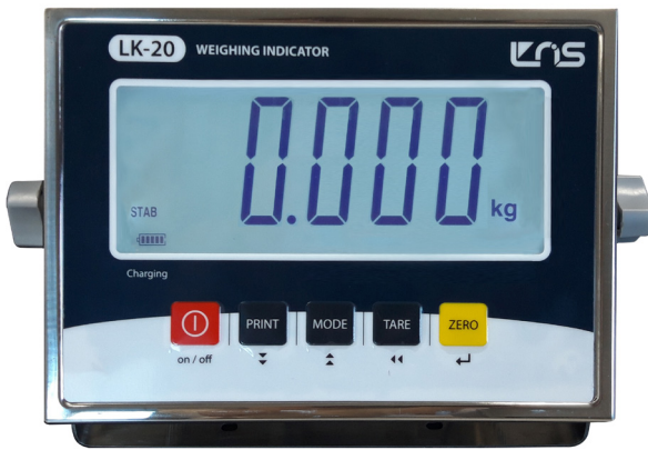
LK-20 인디케이터 LCD 디스플레이