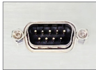
RS-232C 통신 케이블