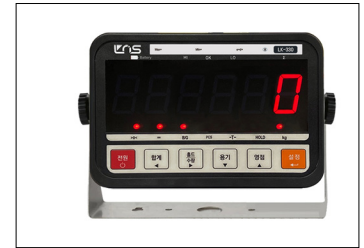
LK-330 인디케이터 밝고 선명한 LED 타입 LED 6자리, 7세그먼트(높이:38mm)